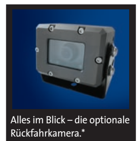
Alles im Blick – die optionale Rückfahrkamera.*

Mit dem pControl erhalten Sie einen passenden USB-Stick für den Datenaustausch. Auf dem Stick befindet sich schon die Demoversion der PC-Software pOffice. Prüfen und testen Sie mit dieser Demoversion, was für Sie von Nutzen ist und ordern Sie einfach die Freischaltung der benötigten Programmteile.